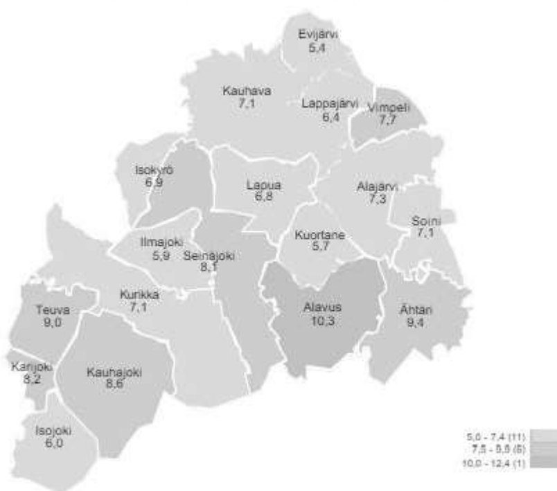
Työttömien työnhakijoiden osuus työvoimasta kunnittain