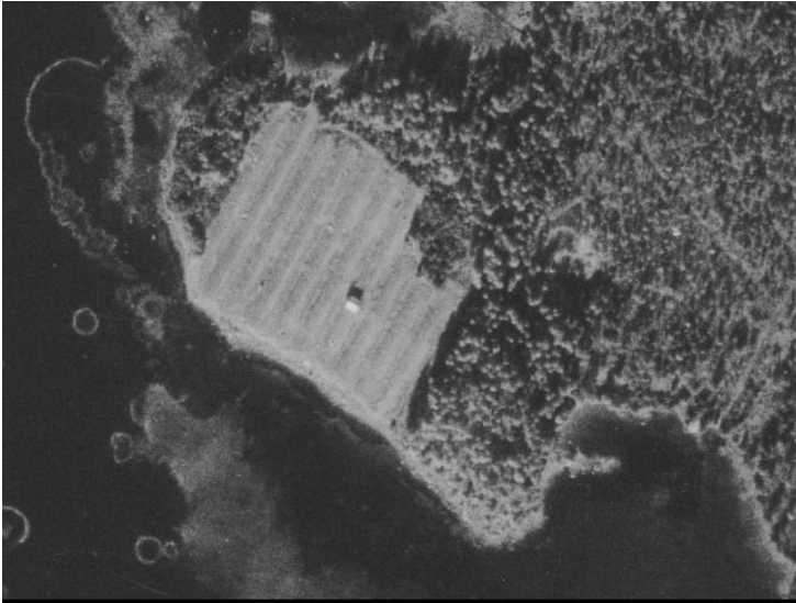
Ilmakuva v. 1949 (Paikkatietoikkuna 6.9.2024)

Vuoden 1949 ilmakuvan perusteella ja peruskartan 1:20 000 v. 1961 alue on ollut avo-ojitettua peltomaata, metsää sekä rämettä, yht. 2,86 ha. Vapaa-ajanasutusta on rakentunut alueelle myöhemmin, jolloin peltoviljely on jo loppunut ja pelto kasvanut umpeen.