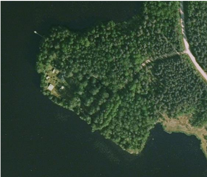
Ilmakuva v. 2019 (Paikkatietoikkuna 6.9.2024)